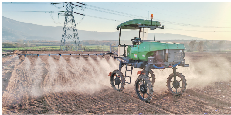
高地隙无人植保机