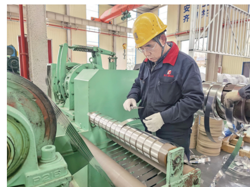
检测产品 东力重工生产车间

近年来，这家老牌企业不满足于国内市场，正积极拓展海外版图。如今，东力重工拥有40余项专利，产品远销